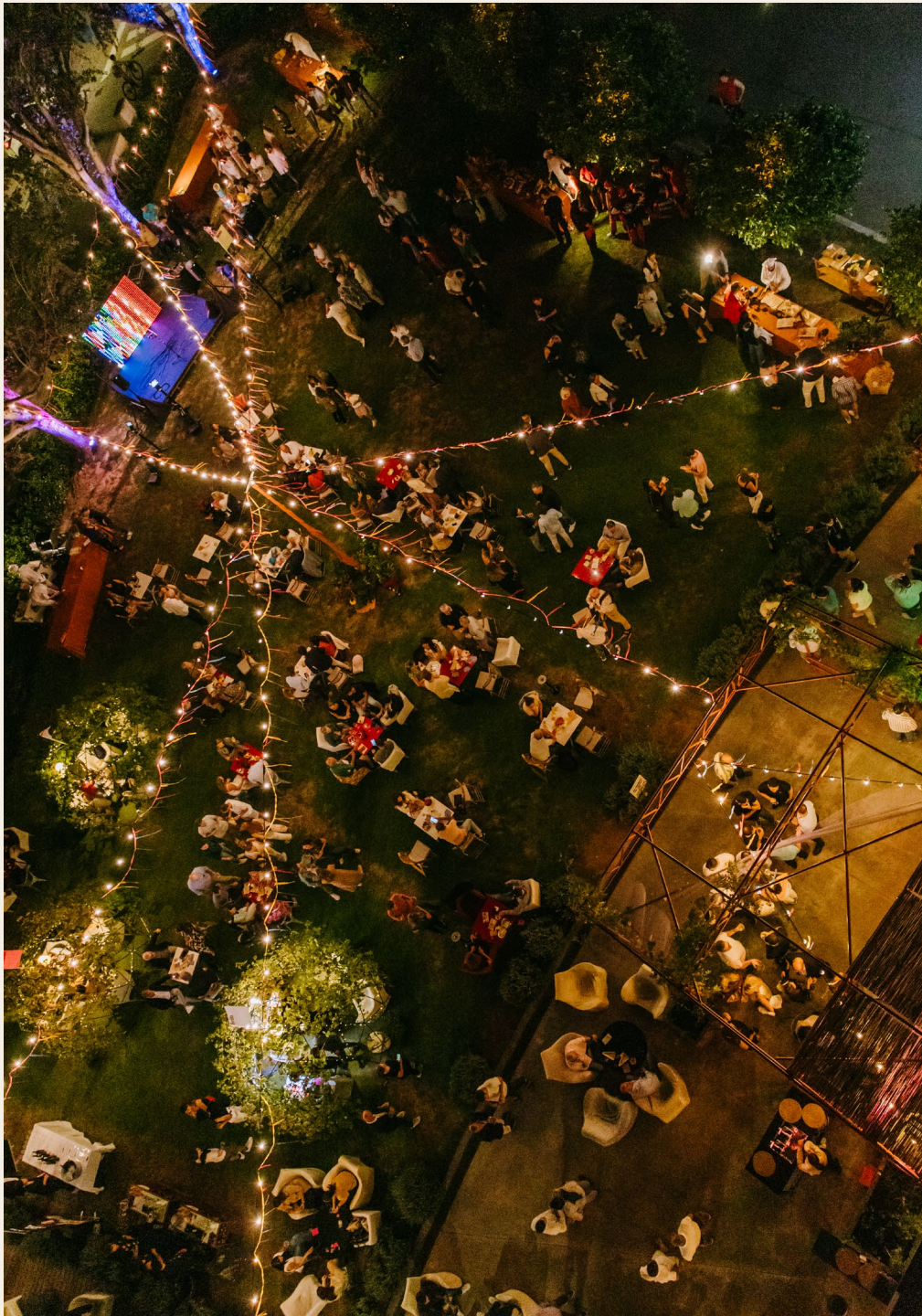
El Sant Cugat Hotel