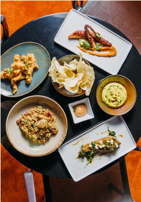
Menús para eventos