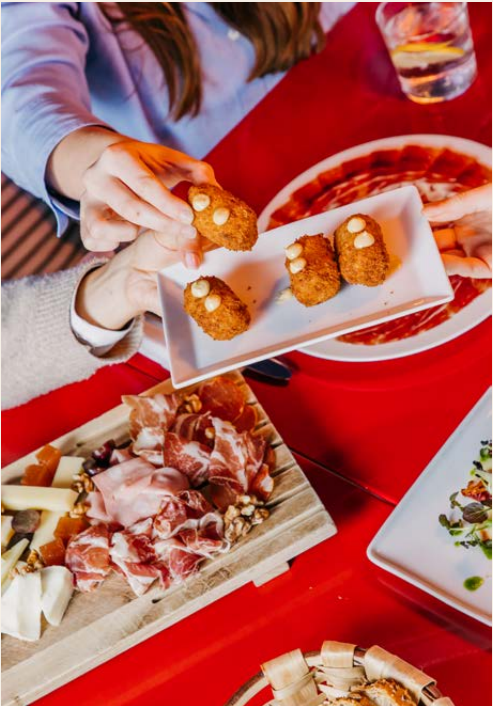
P. 8 / 10