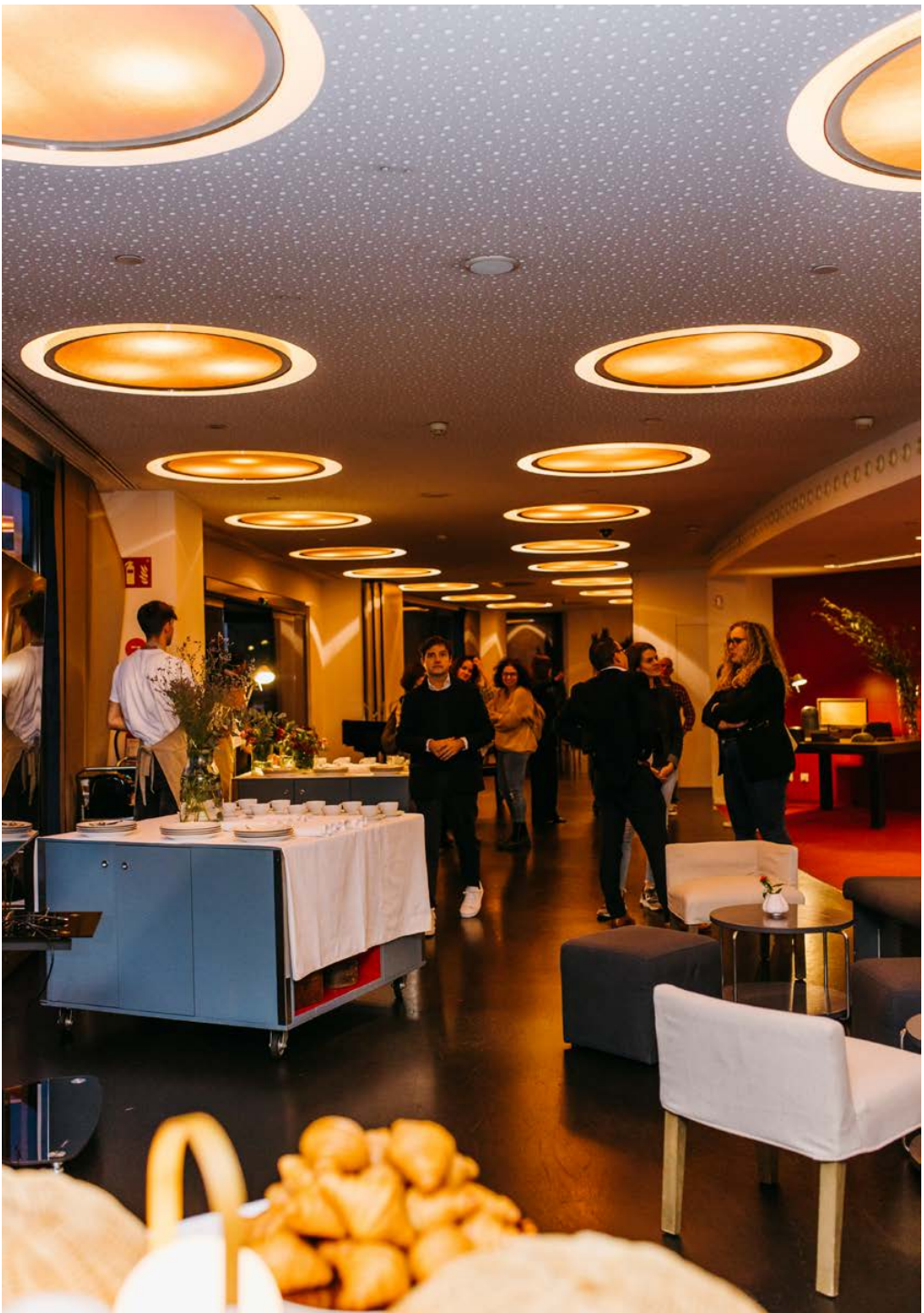
Espacios para eventos