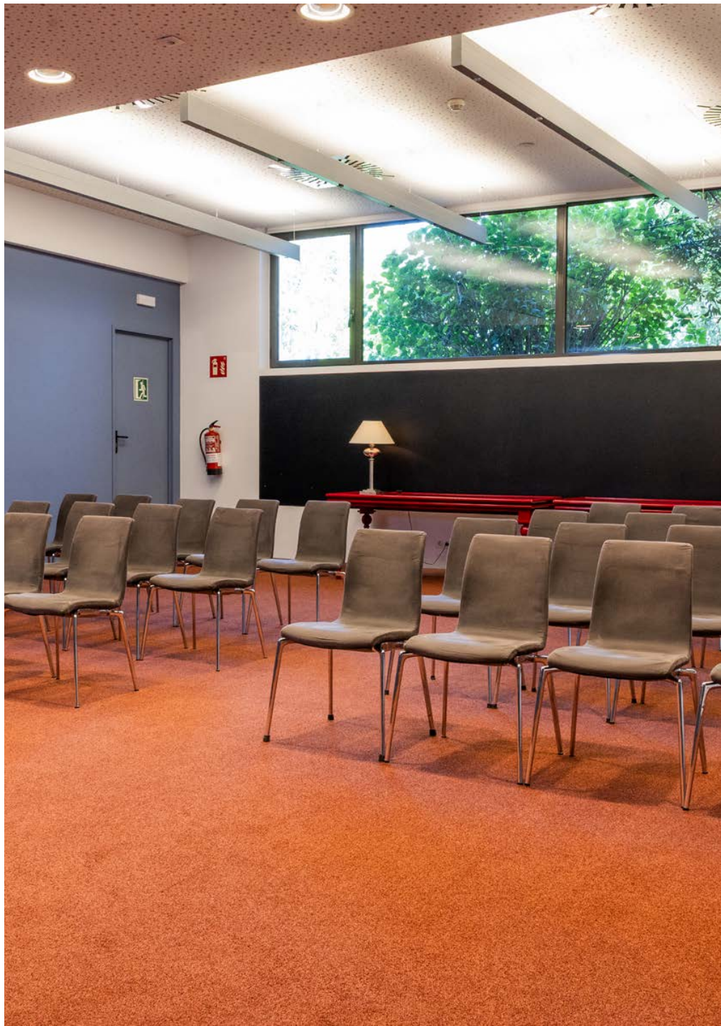
El Sant Cugat Hotel